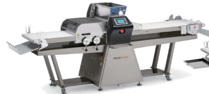
Industrial Smart 6516