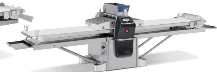
Auto Smart 7000