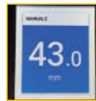
▲ ローラー間隔はデジタル表示されます。 ※Lam2Eはデジタル表示はありません。